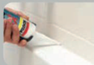
Sanitary joints Application sanitaire

For perfect results pour le résultat parfait