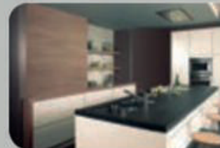
Bathrooms & Kitchens Salles de bain & cuisine